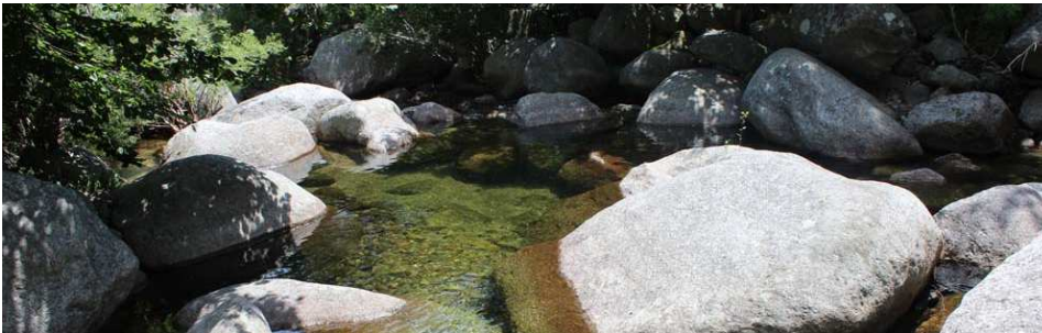
A.LAURENT - ABCèze

Le Rieutort et la Gourdouze sont des affluents rive gauche du Luëch, lui-même affluent de la Cèze. Ils prennent leur source sur le versant sud du Mont Lozère à 1400m d'altitude et traversent la commune de Vialas, dans le département de la Lozère.