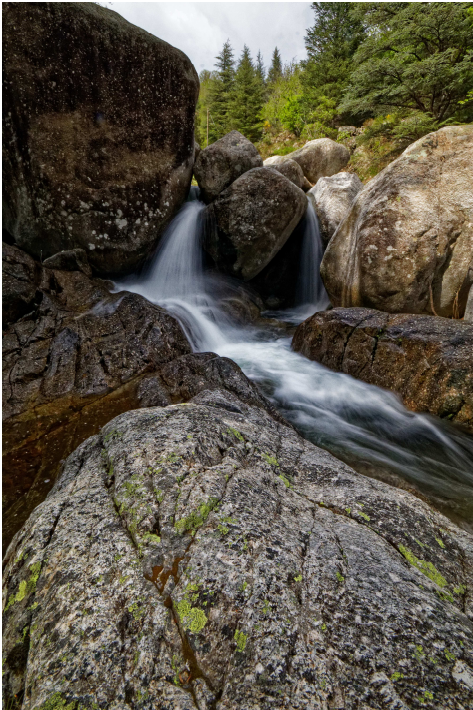
Y. MANCHE - PNC